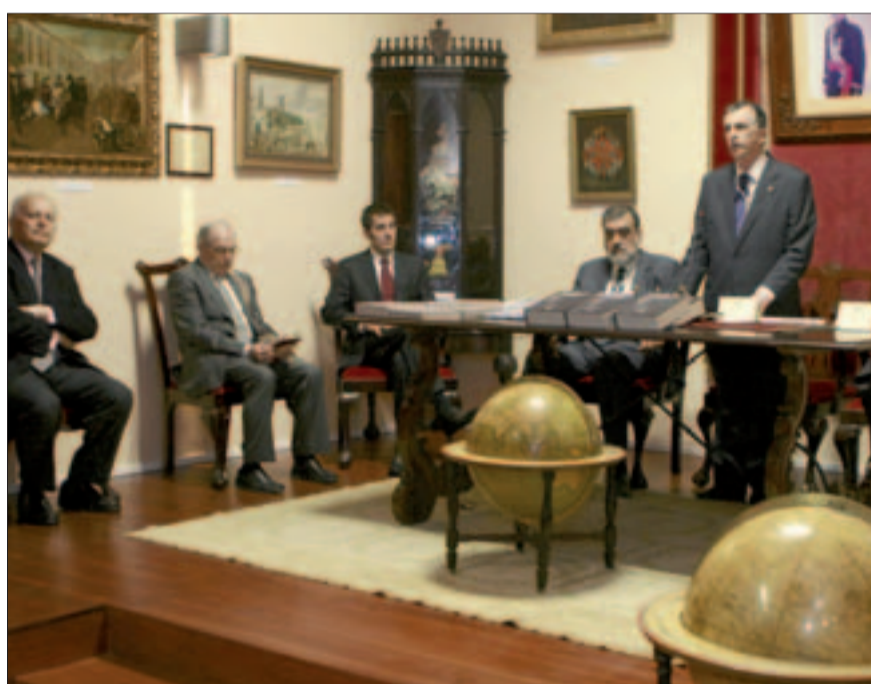
La Real Sociedad Económica de Amigos del País conserva una de las mayores colecciones de patrimonio de Agüere.

Las mejoras en determinadas infraestructuras culturales que ha vivido La Laguna, como la restauración del Teatro Leal o de la Real Sociedad Económica, ha contribuido a mejorar notablemente también la vida económica de la ciudad.